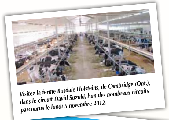
Visitez la ferme Bosdale Holsteins, de Cambridge (Ont.), dans le circuit David Suzuki, l'un des nombreux circuits parcourus le lundi 5 novembre 2012.