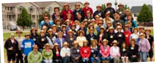
Le personnel de Holstein Canada, à sa rencontre estivale de 2011.

À la réunion de décembre 2011 des conseils d'administration de Holstein Canada et du Réseau laitier canadien (CDN), la décision fut prise d'abandonner les discussions sur le projet de fusion.