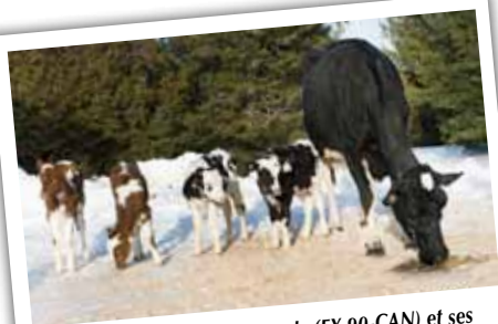
La Sapinière September Retarde (EX-90-CAN) et ses quadruplés, nés d'un seul vêlage, en 2010.