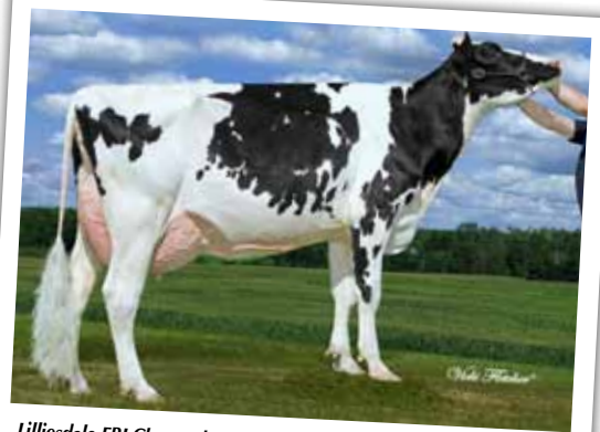
Lilliesdale FBI Charmed (EX-92-CAN)

Arla Jolt PA Pouse (BP-83-3 ans-CAN) CANF100487382 Née le 7 janvier 2002 Éleveur et propriétaire : Conrad Riendeau, Saint-Césaire (Qc) Lait Gras Protéine Production totale (kg) 08-05 305 21 586 883 4,09 706 3,27 MCR (Déviation) 431 (+117) 483 (+147) 450 (+126) 1 364 (+390)