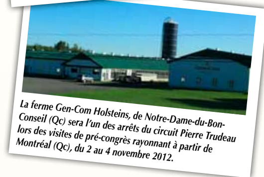
La ferme Gen-Com Holsteins, de Notre-Dame-du-Bon-Conseil (Qc) sera l'un des arrêts du circuit Pierre Trudeau lors des visites de pré-congrès rayonnant à partir de Montréal (Qc), du 2 au 4 novembre 2012.

Gert Pedersen Aamand, du Danemark, sera l'un des nombreux conférenciers de renommée internationale au symposium du Congrès mondial Holstein 2012, les 6 et 7 novembre. Gert parlera de la « sélection (des vaches) pour la résistance aux maladies ». Lucy Andrews, du Royaume-Uni, discutera pour sa part du « rôle des sociétés de races dans la durabilité de l'industrie pour les générations futures ».